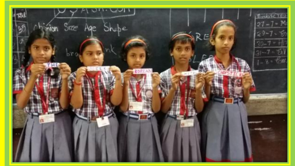
INNOVATIVE PRACTICES FOR TEACHING