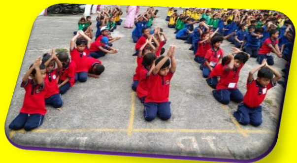
INTERNATIONAL YOGA DAY