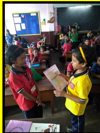
ENG. CARD READING