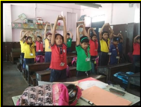
YOGA IN CLASSROOM