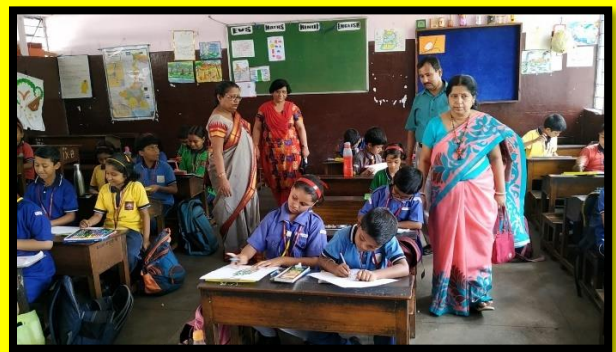
DRAWING COMPETITION FROM MSF