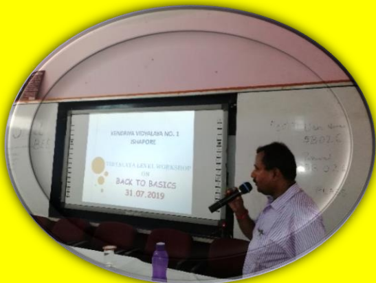
BACK TO BASIC WORKSHOP